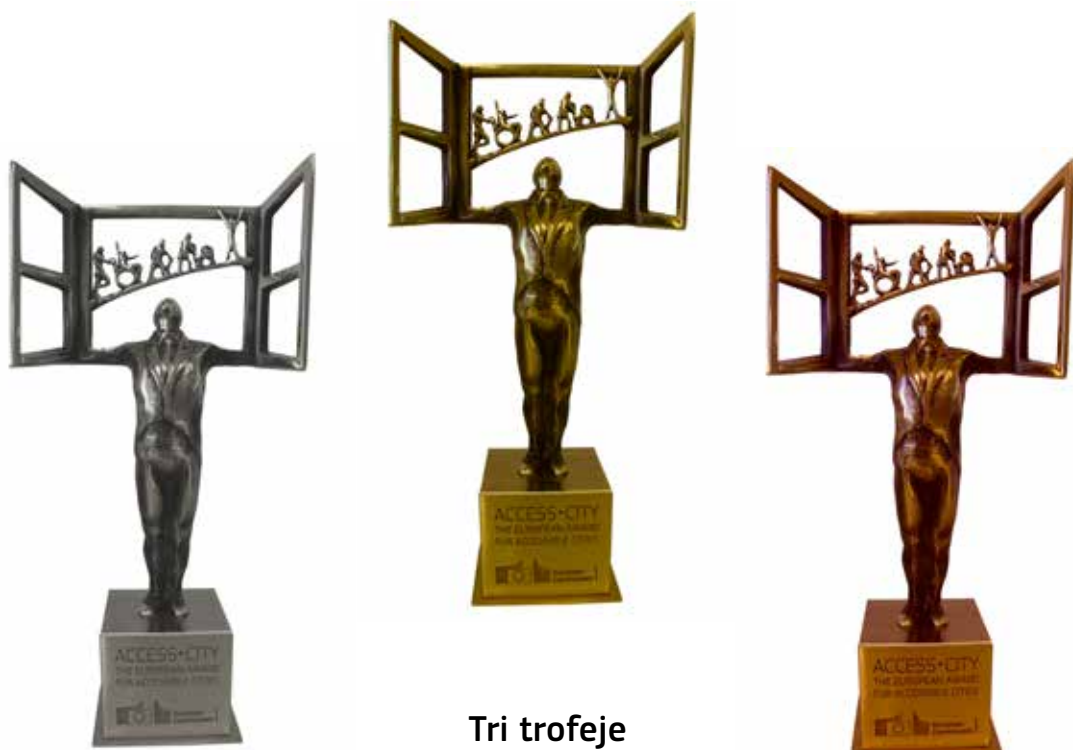
Tri trofeje Access•City Award 2015