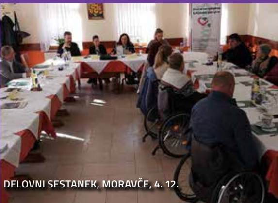
DELOVNI SESTANEK, MORAVČE, 4. 12.