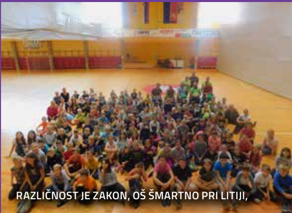
RAZLIČNOST JE ZAKON, OŠ ŠMARTNO PRI LITJI,