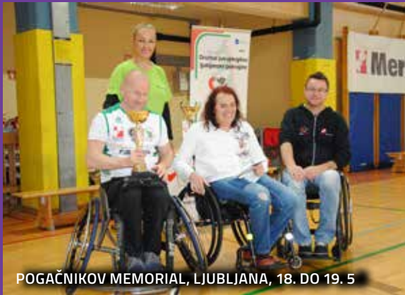
POGAČNIKOV MEMORIAL, LJUBLJANA, 18. DO 19. 5