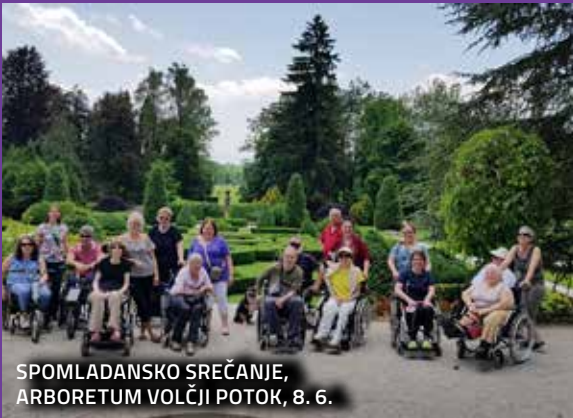
SPOMLADANSKO SREČANJE, ARBORETUM VOLČJI POTOK, 8. 6.