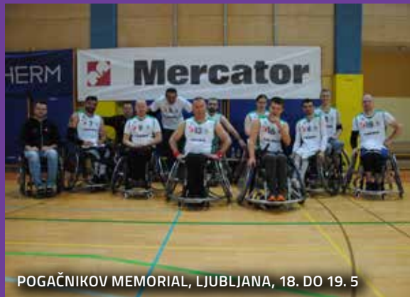
POGAČNIKOV MEMORIAL, LJUBLJANA, 18. DO 19. 5