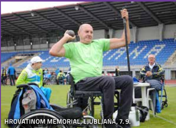
HROVATINOM MEMORIAL, LJUBLJANA, 7. 9.