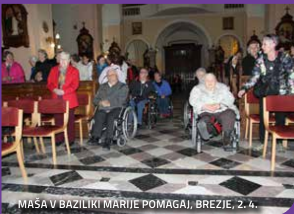
MAŠA V BAZILIKI MARIJE POMAGAJ, BREZJE, 2. 4.