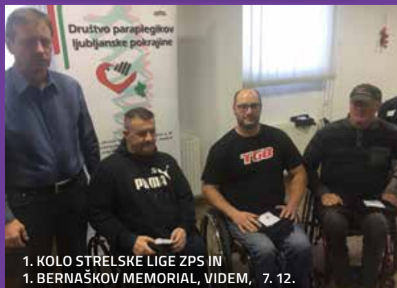
1. KOLO STRELSKE LIGE ZPS IN 1. BERNAŠKOV MEMORIAL, VIDEM, 7. 12.