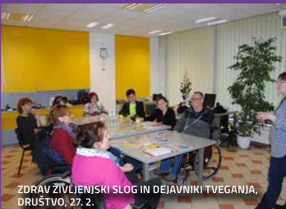
ZDRAV ŽIVLJENJSKI SLOG IN DEJAVNIKI TVEGANJA, DRUŠTVO, 27. 2.