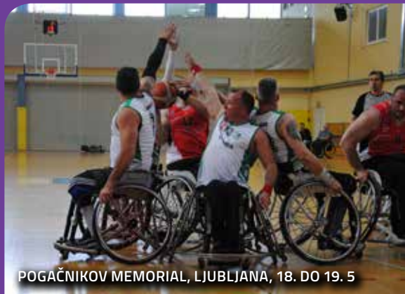
POGAČNIKOV MEMORIAL, LJUBLJANA, 18. DO 19. 5