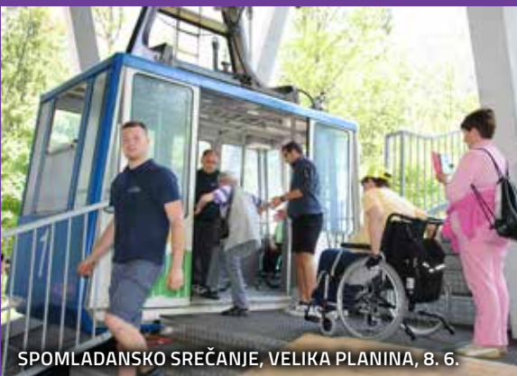
SPOMLADANSKO SREČANJE, VELIKA PLANINA, 8. 6.