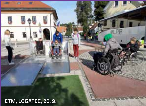
ETM, LOGATEC, 20. 9.