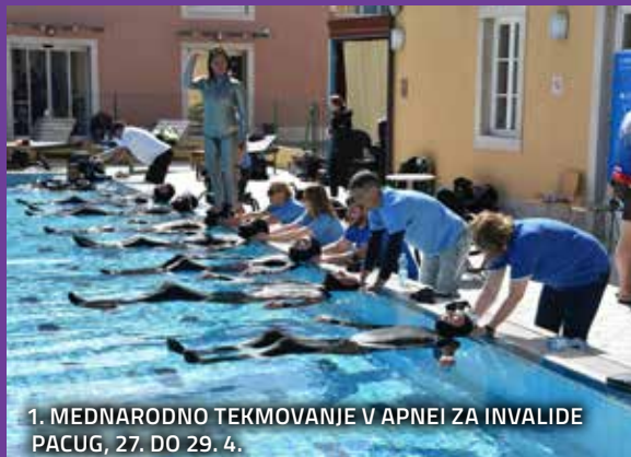
1. MEDNARODNO TEKMOVANJE V APNEI ZA INVALIDE PACUG, 27. DO 29. 4.