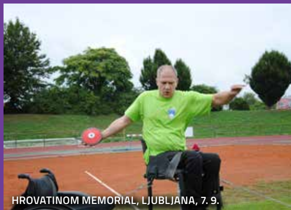
HROVATINOM MEMORIAL, LJUBLJANA, 7. 9.