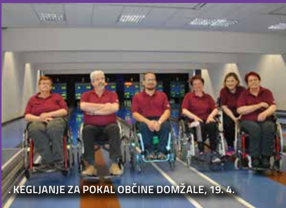
. KEGLJANJE ZA POKAL OBČINE DOMŽALE, 19. 4.