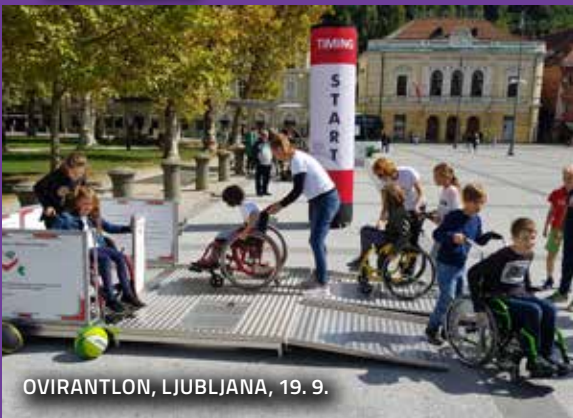
OVIRANTLON, LJUBLJANA, 19. 9.