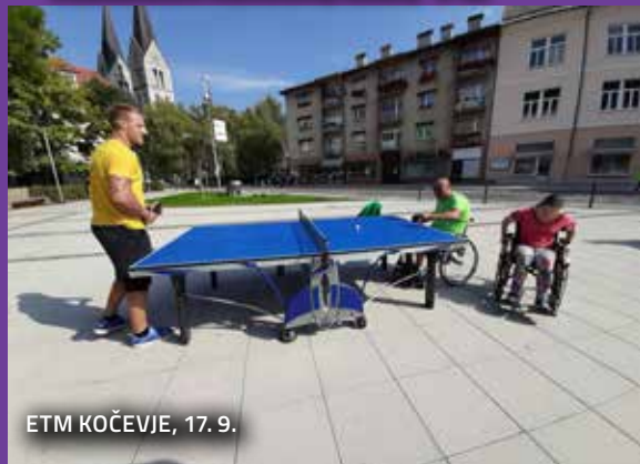
ETM KOČEVJE, 17. 9.