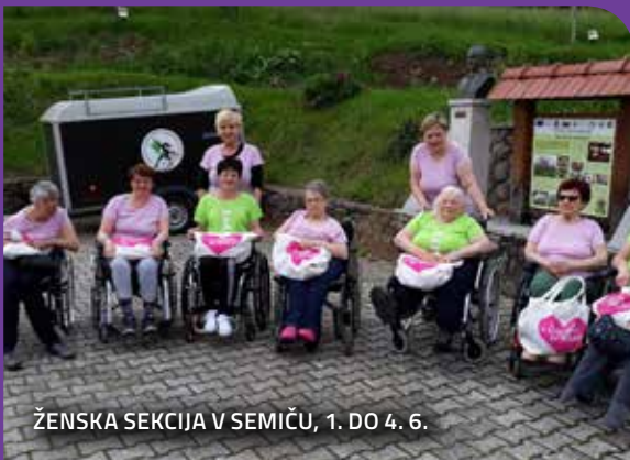
ŽENSKA SEKCIJA V SEMIČU, 1. DO 4. 6.