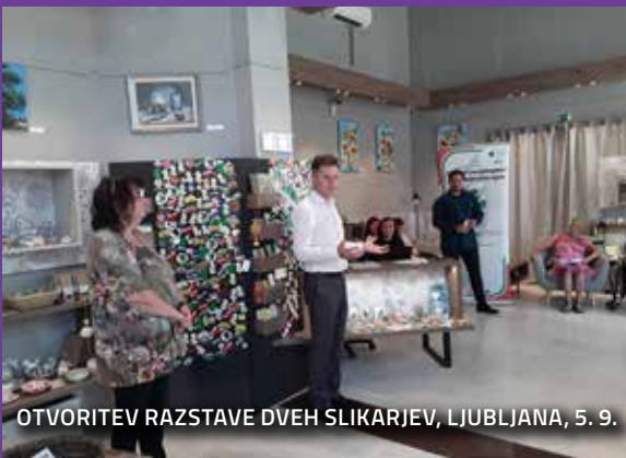
OTVORITEV RAZSTAVE DVEH SLIKARJEV, LJUBLJANA, 5. 9.