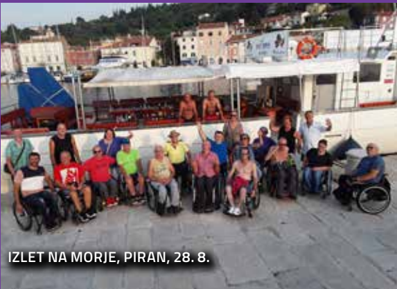
IZLET NA MORJE, PIRAN, 28. 8.