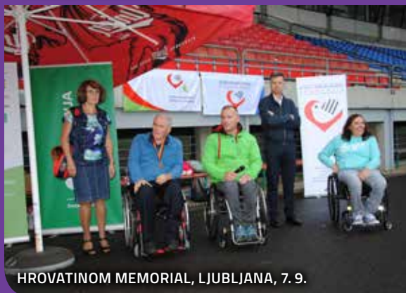
HROVATINOM MEMORIAL, LJUBLJANA, 7. 9.