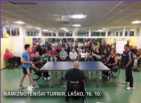
NAMIZNOTENIŠKI TURNIR, LAŠKO, 16. 10.