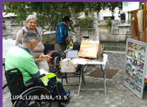
LUPA, LJUBLJANA, 13. 9.