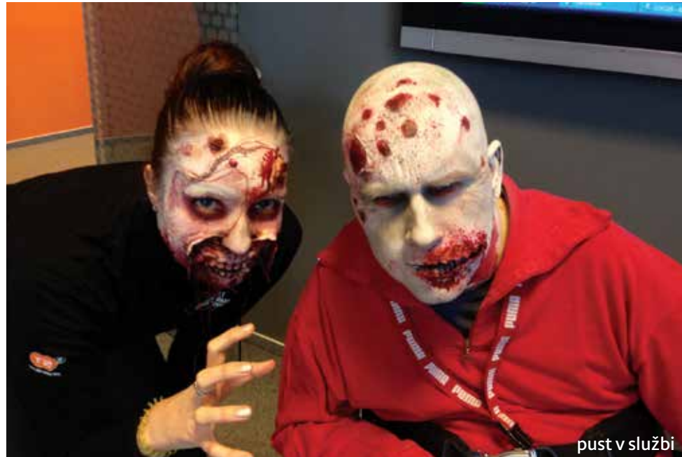
pust v službi

Ja, na voziček ne gledam več kot na oviro, ampak kot na pripomoček. Sicer ne bi imel nič proti, če bi ga vzeli stran in me postavili na noge,